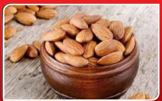
ଫୁସଫୁସ କ୍ୟାନସର ରୁ କରୁବ ବାବାମ