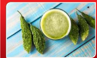
ରକ୍ତରେ ଶର୍କରା ନିୟନ୍ତ୍ରଣ କରେ କଲଭା କୁସ୍