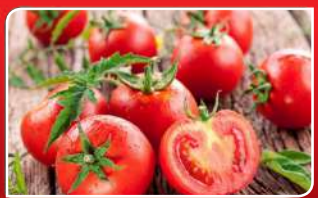
ସାମ୍ବୁ ଉପଯୋଗୀ ଚମାଚୋ