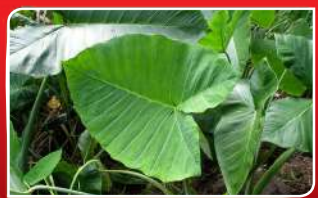
ଲାଭଦାୟକ ସାରୁ ପତ୍ର