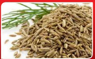
ଜିରା କମ୍ କରିବ ବେଗ