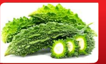
ଢେନ କମାଇବ କଲରା