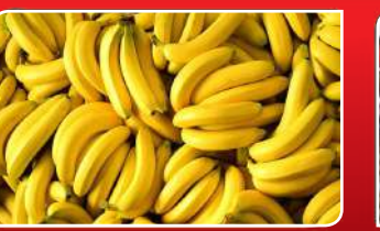
ଦେହକୁ ହିତ କଦଳୀ