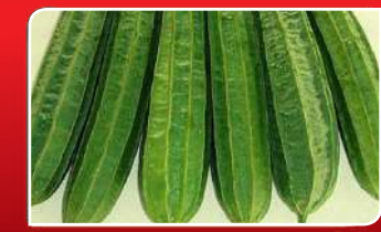
କାଢ଼ା ପିଉଥିଲେ ସର୍ତ୍ତକ ରହୁଛି ଜେନ କମ୍ କରିବାରେ ସହାୟକ କାକୁଡ଼ି ପେଟ ବର୍ଦ୍ଧି କମାଇବ ଦୁଳଦୀ କର୍କଟରୁ ରକ୍ଷା କରିବ କଦଳୀ ପତ୍ର ଜହ୍ନିର ଉପକାରିତା