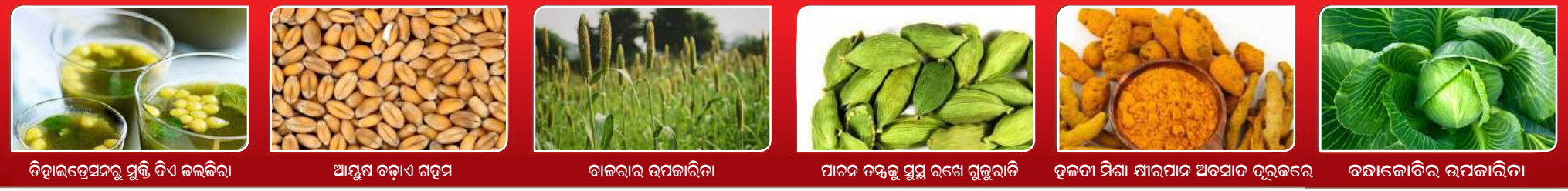
ତିହାଇପେସନରୁ ସୁକ୍ତି ବିଏ କଳକିରା ଆୟୁଷ ବଡ଼ାଏ ଗହମ ବାକରାଉ ଉପକାରିତା ପାଚେଡ଼ ତନ୍ତୁକୁ ସୁସ୍ଥ ରଖେ ଗୁଜୁରାତି ଦଳଦା ମିଶା ଶାରପାଦ ଅବସାଦ ଦୂରକରେ ବନ୍ଧାକୋବିର ଉପକାରିତା