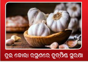
ତୁଳ କୋଲା ରସୁଣରେ ଦୁର୍ବଳ ସୁରକ୍ଷା