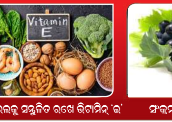
କୋଲେଷ୍ଟରଲକୁ ସମ୍ବଳିତ ରଖେ ଭିନାମିଡ୍ 'ଇ'