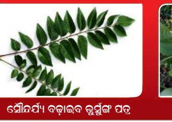
ସୌନ୍ଦର୍ଯ୍ୟ ବଢ଼ାଇବ ଭୃସୁଳ ପତ୍ର