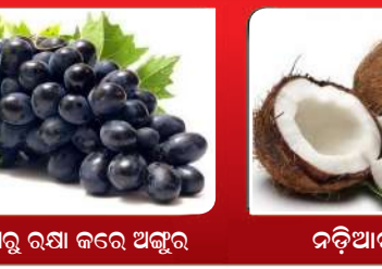
ଫଳପ୍ରସରୁ ରକ୍ଷା କରେ ଅକ୍ସୁର