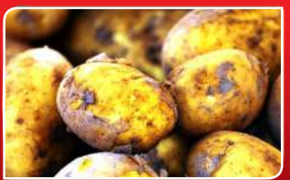
ସୁସ୍ଥ ରଖେ ବେଶୀ ଆଳୁ