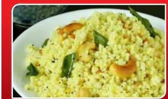
ପୋଷଣରେ ଭରପୁର ମିଲେଟ୍ସ