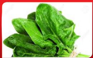
ଦେହକୁ ହିତ ପାଳକ