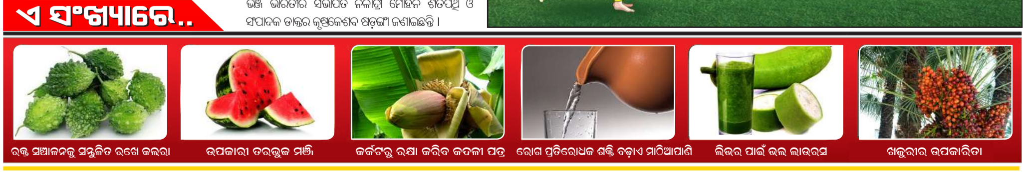
ରକ୍ତ ସାମ୍ୟାନୁକ୍ରମ ସୁସ୍ଥକୃତ ରଖେ କଲରା ରପକାରୀ ତରତୁଳ ମଞ୍ଜି ଜର୍ଜରୁ ରକ୍ଷା କରିବ କଦଳୀ ପତ୍ର ରୋଗ ପ୍ରତିରୋଧକ ଶକ୍ତି ବଢ଼ାଏ ମାଠିଆପାଣି ଲିଭର ପାଇଁ ଭଲ ଲାଭରସ ଖଜୁରୀର ଉପକାରଣ