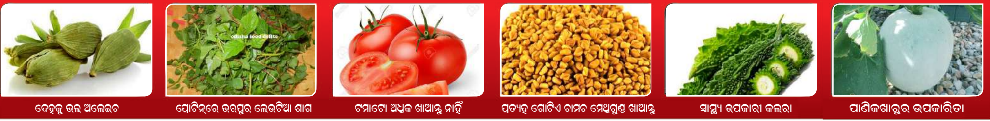
ଦେହକୁ ଭଲ ଅଲେଇର ପ୍ରୋଟିନ୍‌ରେ ଭରପୁର ଲେଉଟିଆ ଗାଗ ଚମାଚେ ଅଧିକ ଖାଆନ୍ତୁ ନାହିଁ ପ୍ରତ୍ୟହ ଗୋଟିଏ ଦାମର ମେଥିଗୁଣ ଖାଆନ୍ତୁ ସାମ୍ବୁ ଉପକାରୀ କଲରା ପାଣିକଖାରୁର ଉପକାରିତା

ନୂଆଦିଲ୍ଲୀ : ଆଉ ଅଳ୍ପ ଦିନ ଭିତରେ ନିର୍ବାଚନ ଗନ୍ତୁ ଶେଷ ହେବାକୁ ଯାଉଥିବା ବେଳେ ଆୟକର ବିଭାଗ କିନ୍ତୁ ଏହି ସମୟ ଭିତରେ ରେକର୍ଡ ପରିମାଣର ନଗଦ ଟଙ୍କା ଓ ଗହଣା ଜବତ କରିଛି । ଜବତ ହୋଇଥିବା ଗହଣା ଓ ଟଙ୍କା ପରିମାଣ ୧୧୦୦ କୋଟି ଟଙ୍କାରୁ ଅଧିକ । ସୂଚନା ଅନୁସାରେ ମେ' ୩୦ ସୁଦ୍ଧା ଯେତିକି ଟଙ୍କା ଓ ଗହଣା ଜବତ ହୋଇଛି ତାହା ୨୦୧୯ ଲୋକସଭା ନିର୍ବାଚନ ସମୟରେ ହୋଇଥିବା ଜବତ ତୁଳନାରେ ୧୮.୨% ଅଧିକ । ୨୦୧୯ରେ ୩୯୦ କୋଟି ଟଙ୍କା ଜବତ କରାଯାଇଥିଲା । ଏଥର ଜବତ ପରିମାଣ ୧୧୦୦ କୋଟିରୁ ଅଧିକ ରହିଛି । ଚଳିତ ବର୍ଷ ଲୋକସଭା ନିର୍ବାଚନ ପାଇଁ ଆଚରଣବିଧି ଗତ ମାର୍ଚ୍ଚ ୧୬ରେ ଲାଗୁ ହୋଇଥିଲା । ତା' ପରଠାରୁ ଆୟକର ବିଭାଗ ପକ୍ଷରୁ ସନ୍ଦେହଜନକ ଟଙ୍କା ଓ ମୂଲ୍ୟବାନ ଜିନିଷ କାରବାର ଉପରେ ନଜର ରଖୁଥିଲେ । ଜବତ ହୋଇଥିବା ଟଙ୍କା ଓ ଗହଣା ଆଦିକୁ ଭୋଟରଙ୍କୁ ମନାଇବା ଲାଗି ବ୍ୟବହାର କରିବା ଉଦ୍ଦେଶ୍ୟରେ ନିଆଯାଉଥିବା ବେଳେ ଧରାଯାଇଥିଲା । କେନ୍ଦ୍ରୀୟ ଏଜେକ୍ୟୁଟିଭ ନଗଦ ଟଙ୍କା, ମଦ, ମାଗଣା ସାମଗ୍ରୀ, ତୁଟାସ, ଗହଣା ଏବଂ ଅନ୍ୟାନ୍ୟ ମୂଲ୍ୟବାନ ଜିନିଷ କାରବାର ଉପରେ ନଜର ରଖିବା ଲାଗି ପ୍ରତି ରାଜ୍ୟରେ ୨୪ ଘଣ୍ଟିଆ ହେଲ୍ପଲାଇନ୍ କାର୍ଯ୍ୟକାରୀ କରାଯାଇଥିଲା । ସର୍ବାଧିକ ଟଙ୍କା ଓ ଗହଣା ଦିଲ୍ଲୀ ଓ କର୍ଣ୍ଣାଟକ ଅଞ୍ଚଳରେ ଜବତ ହୋଇଛି । ଏହି ଦୁଇ ରାଜ୍ୟରୁ ପ୍ରାୟ ୨୦୦ କୋଟି ଟଙ୍କା ଜବତ କରାଯାଇଛି । ତାମିଲନାଡୁରୁ ୧୫୦ କୋଟି ଟଙ୍କା ଜବତ ହୋଇଛି । ଆନ୍ଧ୍ରପ୍ରଦେଶ, ତେଲଙ୍ଗାନା ଓ ଓଡ଼ିଶାରୁ ମିଳିତ ଭାବେ ୧୦୦ କୋଟି ଟଙ୍କାରୁ ଅଧିକ ଟଙ୍କା ଓ ଗହଣା ଜବତ କରାଯାଇଛି ।