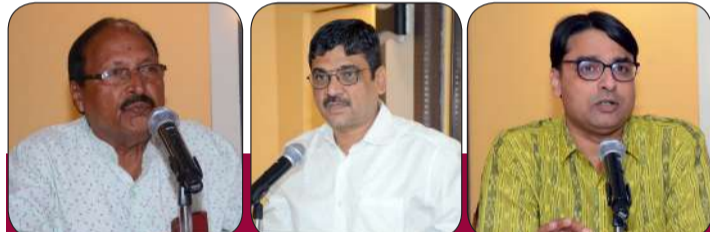
‘ସାକାର’ ପକ୍ଷରୁ ସତ୍ୟ ଆଲୋଚନା ସଭା

ବିଗ୍ରହରେ ଦର୍ଶନ ଦେଇ ନବଜଳେବର ତତ୍ତ୍ଵକୁ ପ୍ରକାଶିତ କରନ୍ତି ବୋଲି ସେ କହିଥିଲେ ।