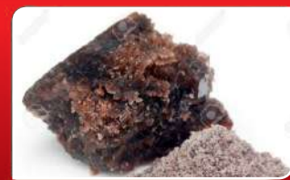
ବଡ଼ ଉତ୍ପାଦନା ସୈନ୍ଧବ ଲବଣ