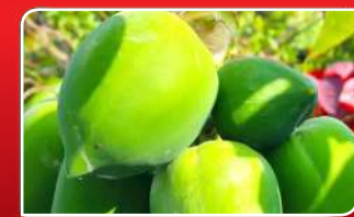
ଇନ୍ଦ୍ରପ୍ରସାଦରୁ ରସାକରେ ଅମୃତଭଣ୍ଡା