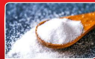
ଧଳା କହର ଲୁଣ