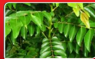
ସୌନ୍ଦର୍ଯ୍ୟ ବଢ଼ାଇବ ତୁମୁଙ୍ଗ ପତ୍ର