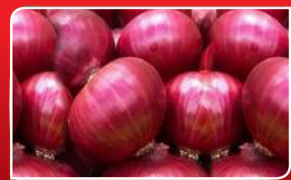
ପିଆଜ ନିୟନ୍ତ୍ରଣ କରିବ ଆଇରଏଚ୍!