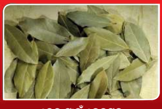
ଦେହ ପାଇଁ ତେଜପତ୍ର