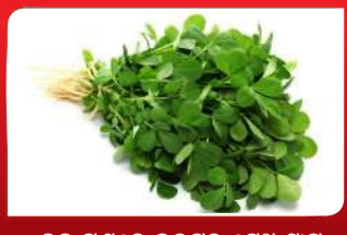
ବହୁ ଗୁଣରେ ଭରପୁର ମେଥ ମାଗ