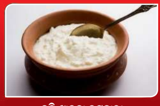
ଦହି ଖାଇବା ଉପକାରୀ