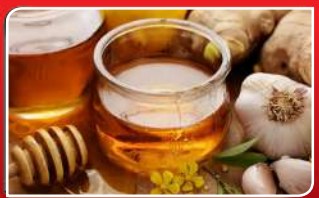
ସାମ୍ବ୍ୟ ଲାଗି ଉପକାରୀ ମଦୁ ଓ ରସୁଣ