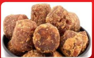
ଆନେମିଆ ରୋଗୀ ଓ ଗୁଡ଼