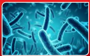
ଜେନ ବୁକି ପାଇଁ ବ୍ୟାକ୍ଟେରିଆ ଦାୟୀ