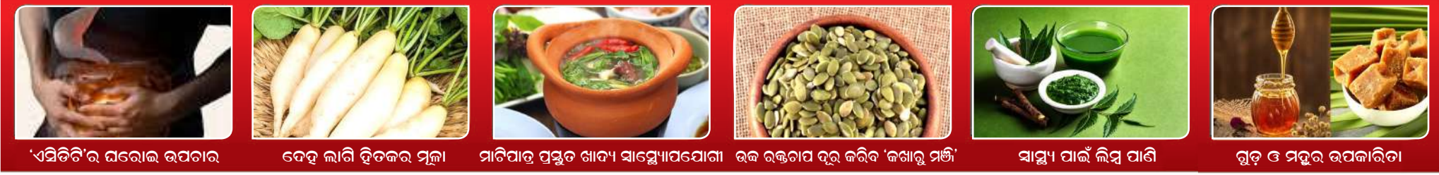
'ଏମିତି'ର ଘରୋଇ ଉପଚାର ବେହୁ ଲାଗି ହିତକର ମୂଳା ମାଟିପାତ୍ର ପସ୍ତୁତ ଖାଦ୍ୟ ସାମ୍ବୋପଯୋଗା ଉଚ୍ଚ ରକ୍ତଚାପ ଦୂର କରିବ 'କଖାରୁ ମଞ୍ଜି' ସାମ୍ବୁ ପାଇଁ ଲିମ୍ବୁ ପାଣି ଗୁଡ଼ ଓ ମଦୁର ଉପକାରିତା