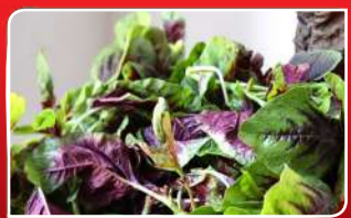
ଖାଦ୍ୟ ଲୋଭ ଦିୟତ୍ଵଶ କରେ ଶାଗ