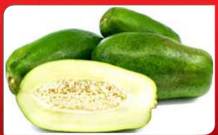
ବହୁ ଉପକାରୀ କଞ୍ଚା ଅମୃତଭଣ୍ଡା