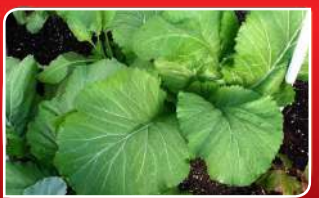
ସୋରିଷ ଶାଗର ଲାଭ