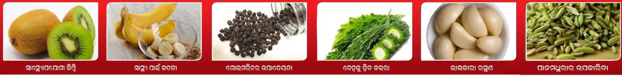
ସାମ୍ବୋପଯୋଗା କିଛି ସାମ୍ବୁ ପାଇଁ କବଳା ଗୋଲମରିଚର ଉପାଦେୟତା ଦେହକୁ ହିତ କଲଇ ଲାଭକାରୀ ରସୁଣ ପାନମଧୁରାର ଉପକାରିତା