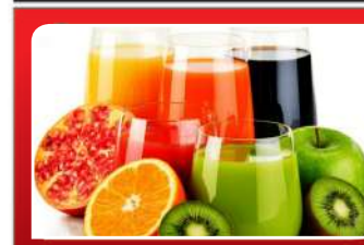
ତୁମ୍ଭ ପିଇ ସୁସ୍ଥ ରୁହନ୍ତୁ