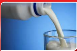
ଶାର ପିଅନ୍ତୁ, ଚାନ୍ଦ ମଜରୁତ ହେବ