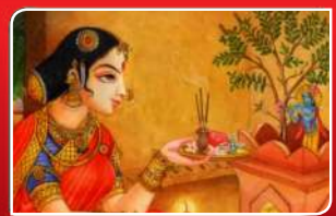
କାର୍ତ୍ତିକ ମାସରେ ତୁଳସୀର ମାହାତ୍ମ୍ୟ