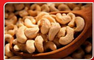
ଅବସାଦର ମହୋତ୍ସବ କାଜୁ