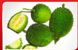
ପ୍ରୋବିନ୍ସରେ ଭରପୂର କାଳଡ଼