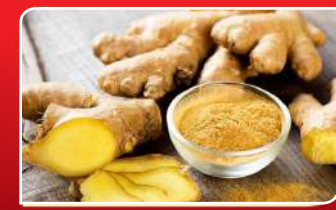
ଜେନ କମାଇବ ଥବା