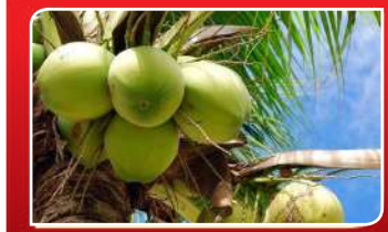
ସାମ୍ବ୍ୟ ପାଇଁ ଲାଭଦାୟକ ପଦ୍ଧତ୍