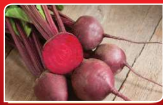
ହିତକାରୀ ପରିବା ବିନ୍