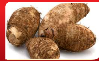
ରୋଗ ପ୍ରତିରୋଧ ଶକ୍ତି ବଢ଼ାଏ ସାରୁ